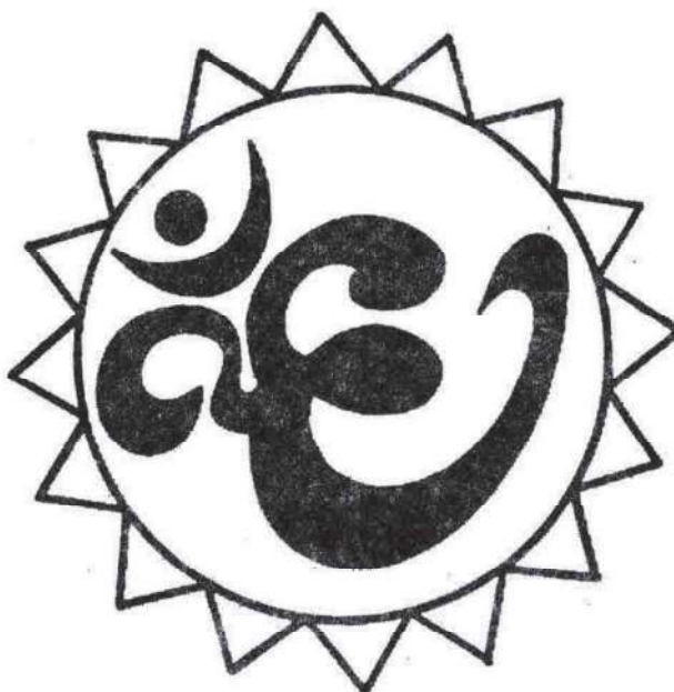
Рисунок для фиксации глаз

Вариант 3. Вокруг знака проведена окружность. Перемещайте свой взгляд по окружности, двигая одновременно глаза и голову. Делайте упражнение вначале с открытыми глазами, затем с закрытыми, представляя окружность.